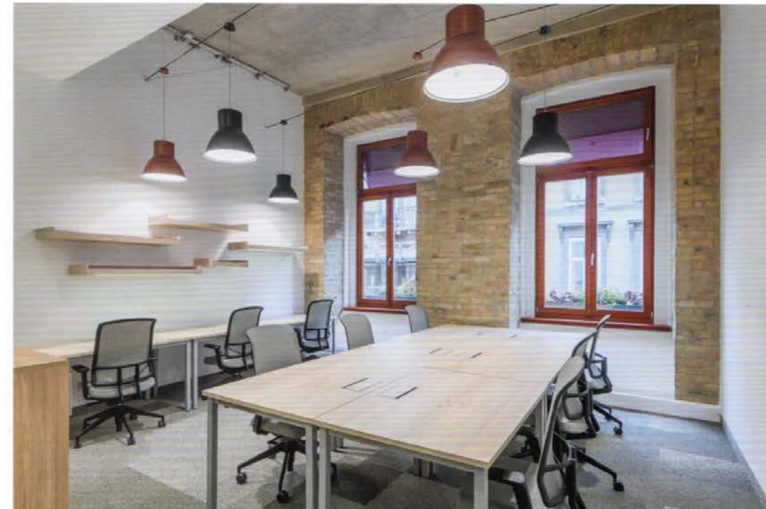
▲ A Vitra ülőbútorokat a Do Work! szállította